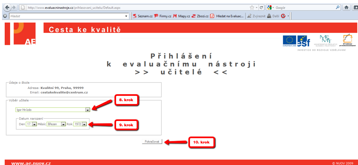
Obrázek č. 4