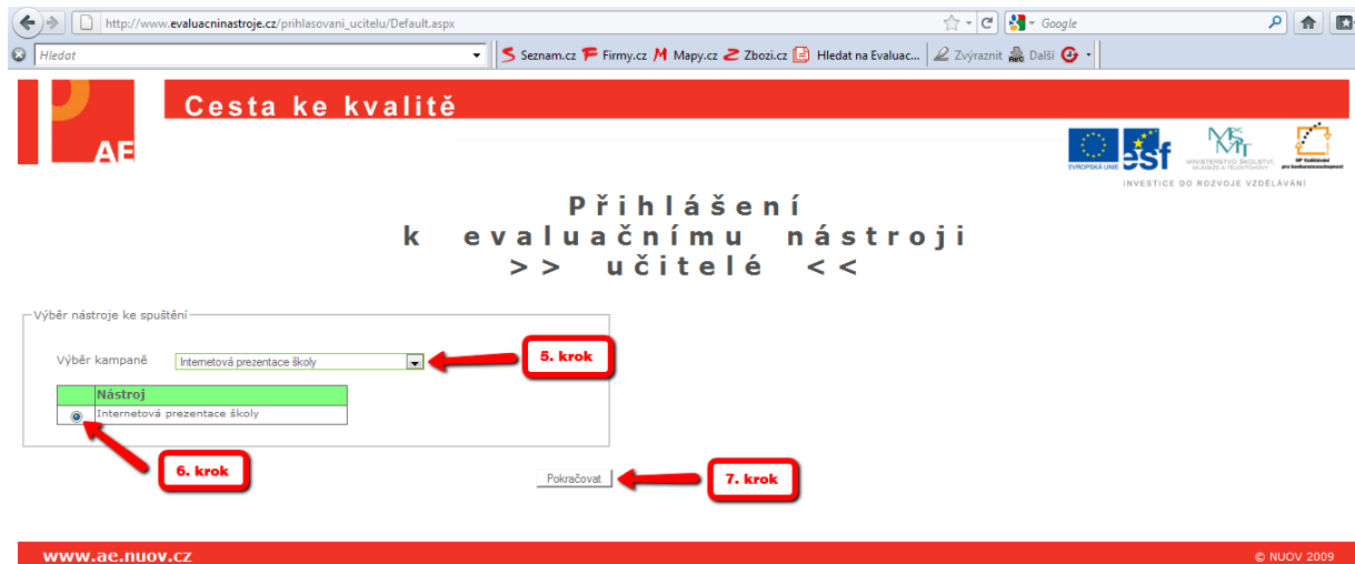
Obrázek č. 3