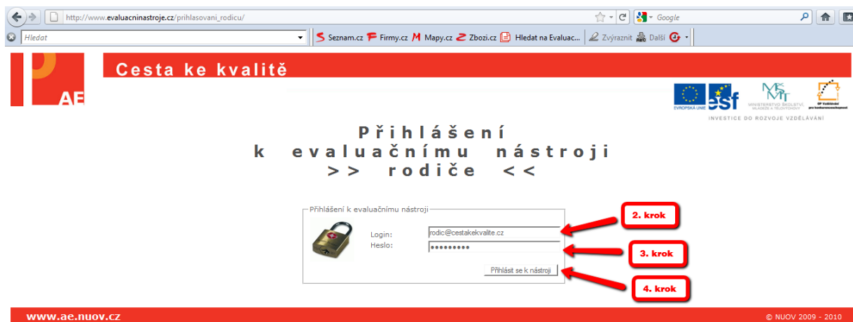
Obrázek č. 2