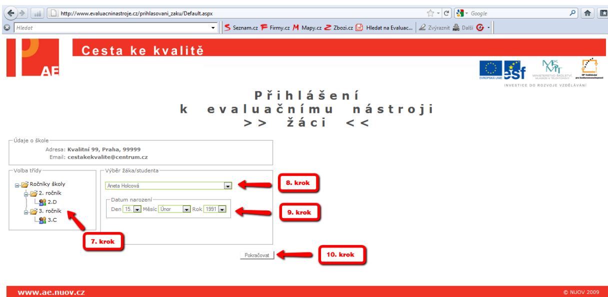
Obrázek č. 4