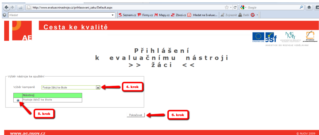
Obrázek č. 3