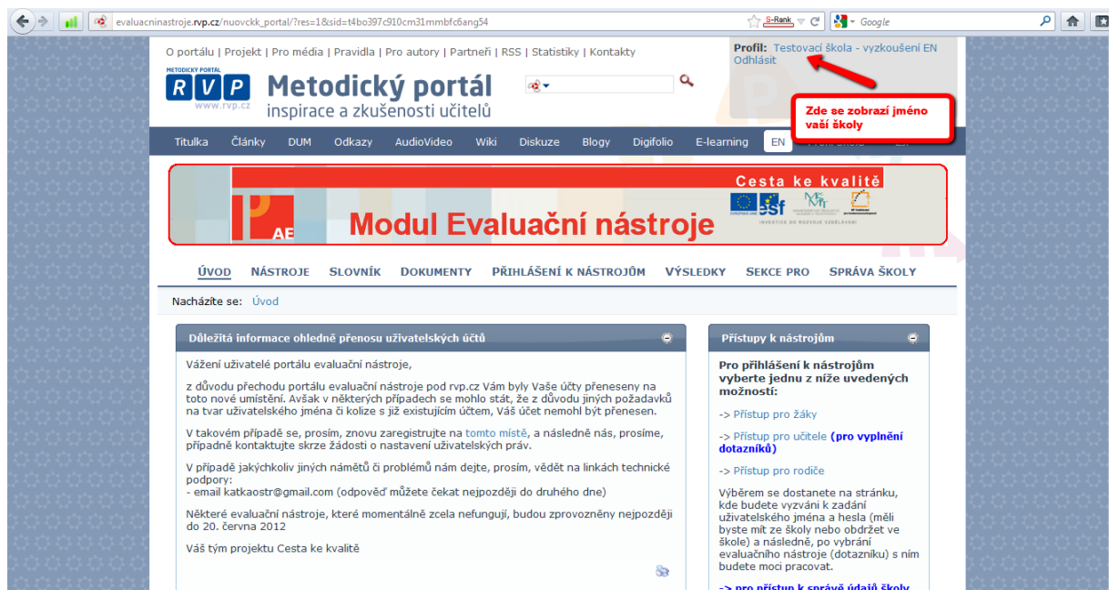
Obrázek č. 1

1. krok – Získání výstupní zprávy musíte být přihlášení (obrázek č. 1).