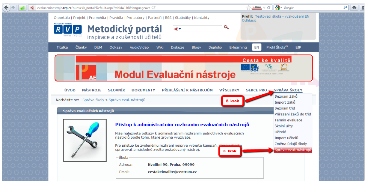
Obrázek č. 2

3. krok – Dále klikněte na „ Správa nástrojů “ (obrázek č. 2).