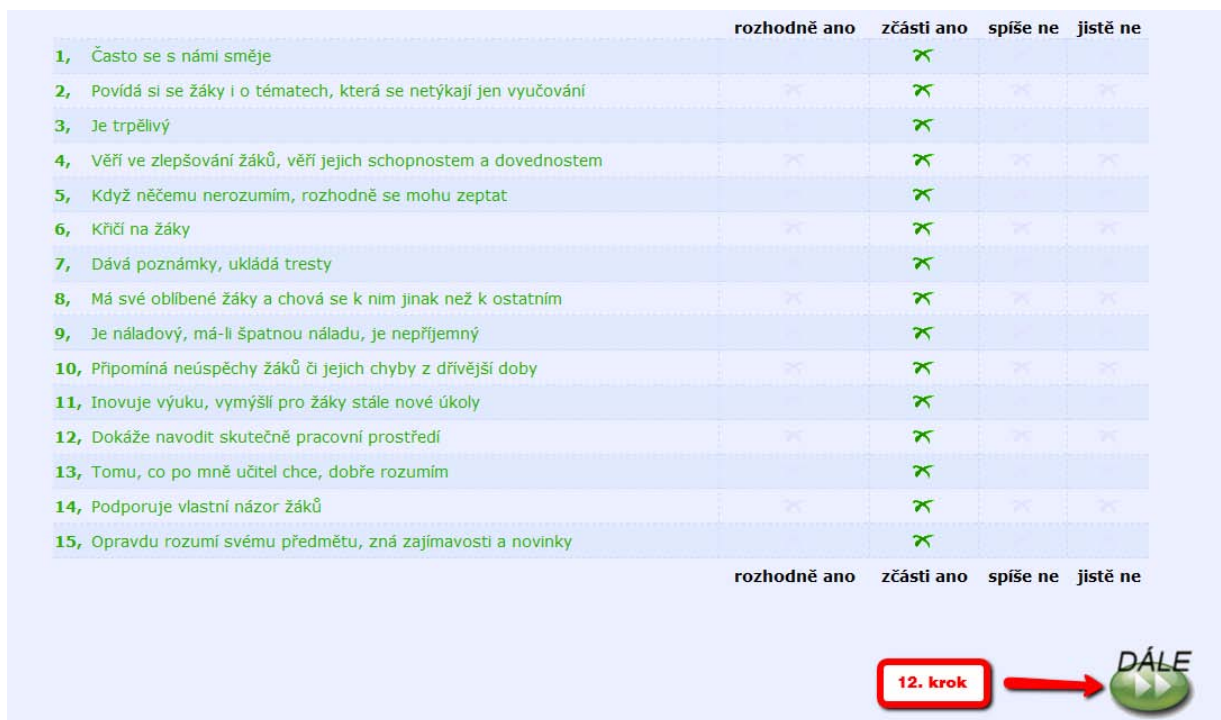
Obrázek č. 7