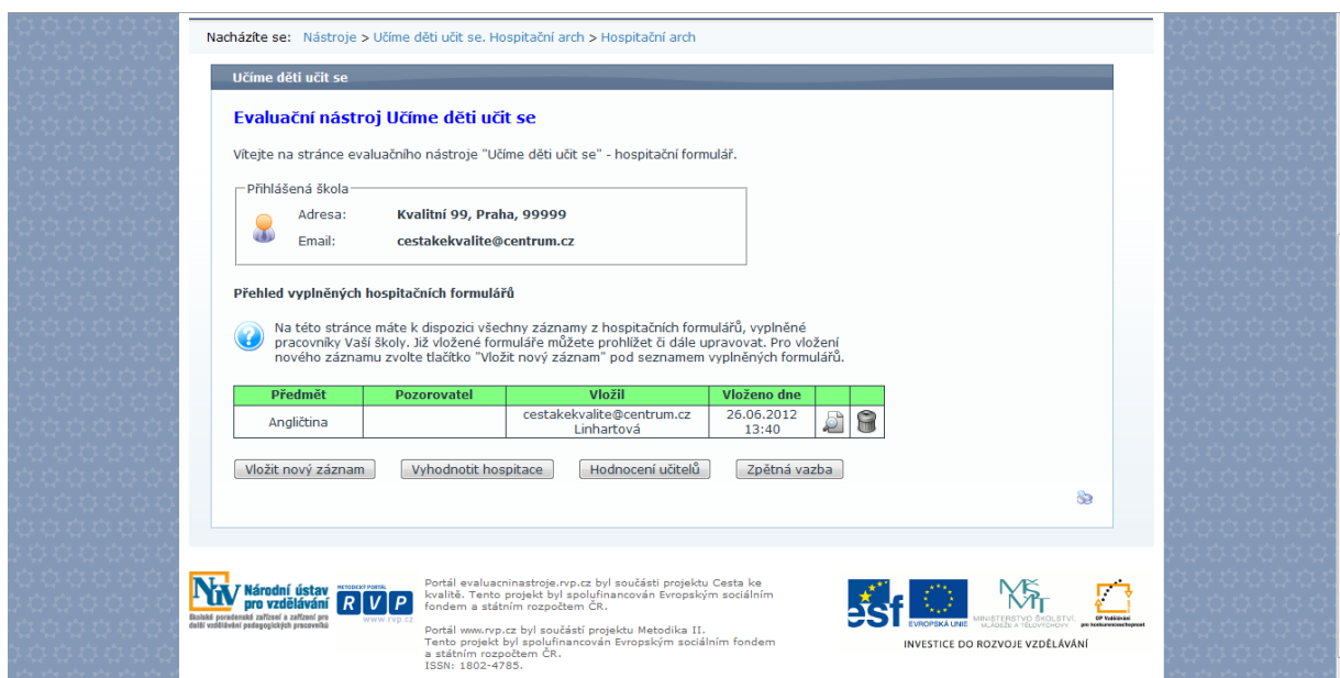
Obrázek č. 8

Takto vypadá záznam o úspěšném vyplnění hospitačního archu (obrázek č. 8).